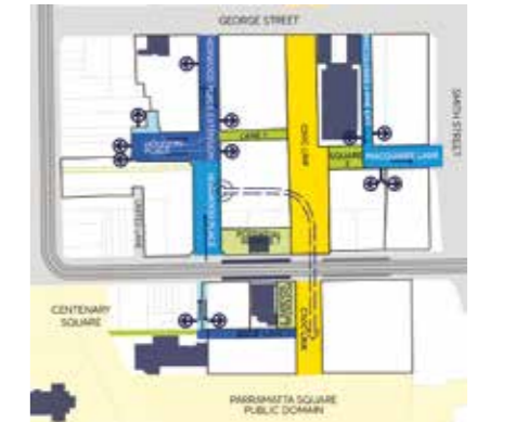
सड़क के प्रकार, पहुंच और सेवा

DCP का मसौदा सीबीडी सिविक लिंग परिसर के ब्लॉक 1, 2 और 4 के लिए लागू होता है। इसके बाद ब्लॉक 3 के लिए DCP बनाई जाएगी, साथ ही चार अलग-अलग सिविक लिंग ब्लॉकों में सार्वजनिक क्षेत्र में आगे के डिज़ाइन को शामिल किया जाएगा। काउंसिल इन परियोजनाओं को साकार करने के लिए समुदाय के साथ मिलकर काम करने की आशा करती है।