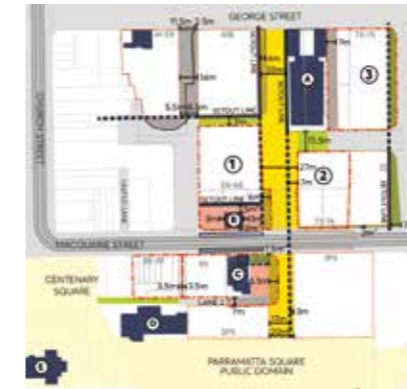
भूमि-संयोजन और भूमि-समर्पण

DCP का मसौदा दर्शाता है कि भविष्य के भवन सिविक लिंग के आकार को कैसे परिभाषित करेंगे और आसपास की आवाजाही कैसे काम करेगी। यह नए सार्वजनिक खुले स्थानों, सड़कों और लेनवे की पहचान करता है; संपत्ति तक पहुंचने का रास्ता और उसकी मरम्मत करने का मार्गदर्शन करता है; भविष्य के भवनों द्वारा सार्वजनिक स्थानों के साथ तालमेल बैठाने के तरीके का वर्णन करता है; और भविष्य के निर्माण की रूपरेखा देता है। नए सिविक लिंग को सक्रिय और जीवंत बनाए रखने के लिए लोगों को चलने-फिरने, उठने-बैठने, मेल-मुलाकात करने और महत्वपूर्ण रूप से हमारे शहर के खूबसूरत केंद्र का आनंद उठाने के अवसर सुनिश्चित करने में DCP एक महत्वपूर्ण भूमिका निभाएगी।